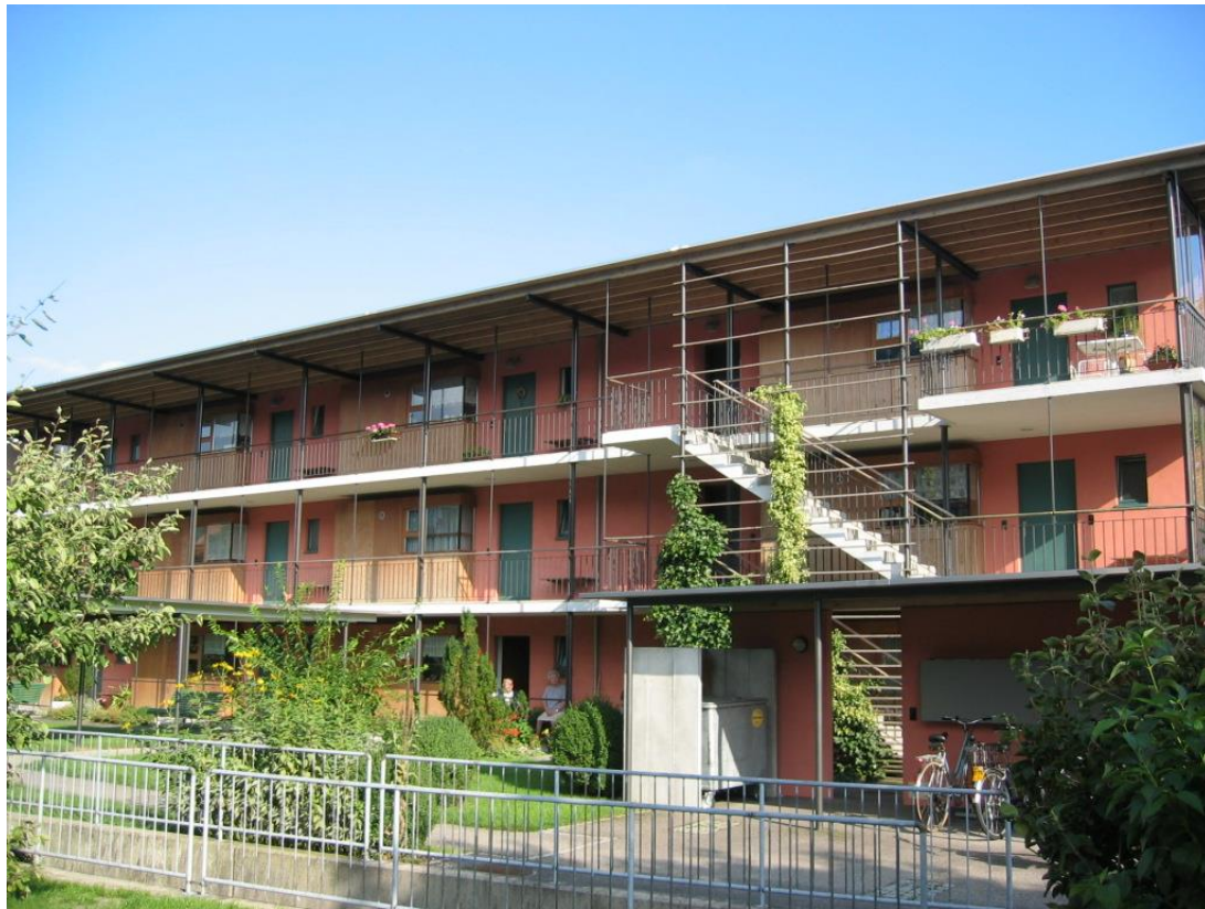
Haus 1 rot Deckergasse 2